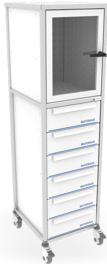
Medidas internas em mm da gaveta refil linha 400