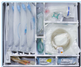
Exemplo de personalização