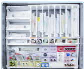
Exemplo de personalização