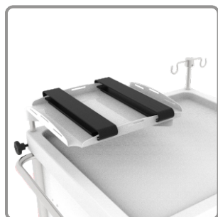
Suporte para desfibrilador