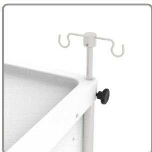
Suporte para soro