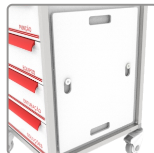
Tábua para massagem cardíaca