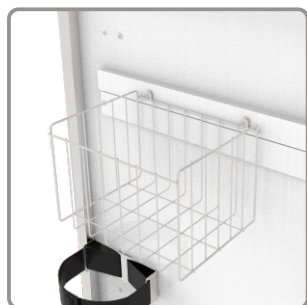
Suporte para caixa de perfuro cortante de 7L