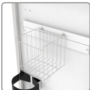
Suporte para caixa de perfuro cortante de 3L