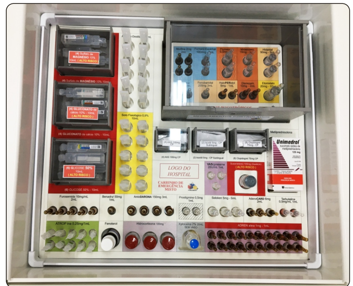
Exemplo de Personalização