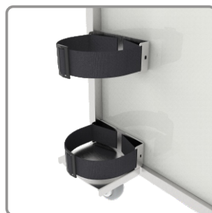
Suporte para cilindro de oxigênio