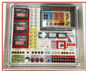
Exemplo de personalização